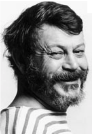
BOBY LAPOINTE 1922 - 1972