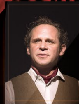
Marcel Pagnol