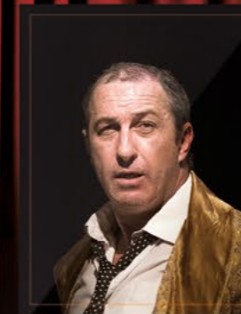
Jules Muraire « Raimu » (Frédéric Achard)